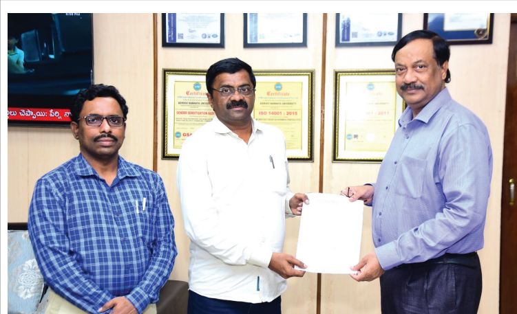
డైరెక్టర్ ఫ్లెస్సింట్ డివిజన్ గా ఉత్తర్వులందిస్తున్న వీసీ